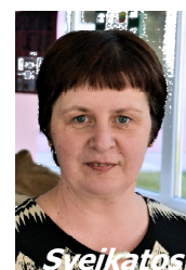
Sveikatos priežiūros specialistė